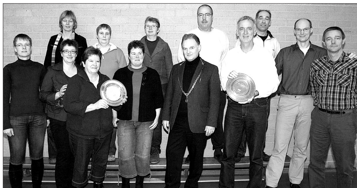
Het derde Lochems recreanten volleybaltoernooi vond afgelopen zondag plaats in de Larense Braninkhal. Tijdens dit toernooi strijden diverse volleybalverenigingen van de gemeente Lochem om de door de gemeente beschikbaar gestelde trofeeën. Het was een sportief en een gezellig toernooi. De winnaar van 2009 is bij de dames S.V. Harfsen en bij de heren Vios Eefde. De organisatie van Tornado blikt tevreden terug en kijkt alweer vooruit naar 17 januari 2010, het vierde toernooi.