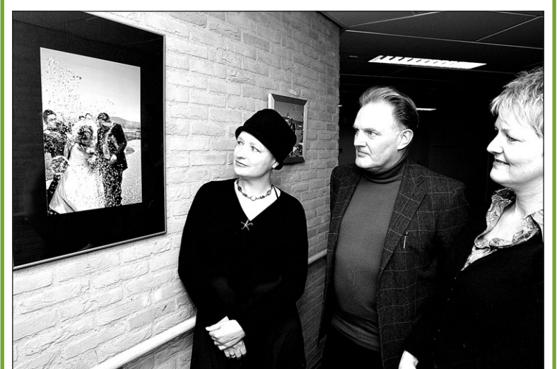
Foto-expositie in Hoge Weide